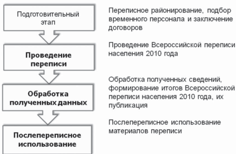
Рис. 1. Общий процесс проведения переписи

Осечки на федеральном уровне. После принятия в конце 2009 г. поправок к Закону № 8-ФЗ 1 , установившему важнейшую процедуру, используемую при проведении всех переписей, включая советский период, – получение сведений о населении из административных источников (паспортных служб) – возникла правовая коллизия с вопросом о национальности, решение которой затянулось до лета 2010 г. и внесло значительную путаницу в правильное заполнение ответа на вопрос о национальном «самоопределении» – самим респондентом или традиционно – «со слов опрашиваемого». Победила статистика! 27 июля 2010 г. Президент России Дмитрий Медведев подписал Федеральный закон № 204-ФЗ «О внесении изменений в отдельные законодательные акты Российской