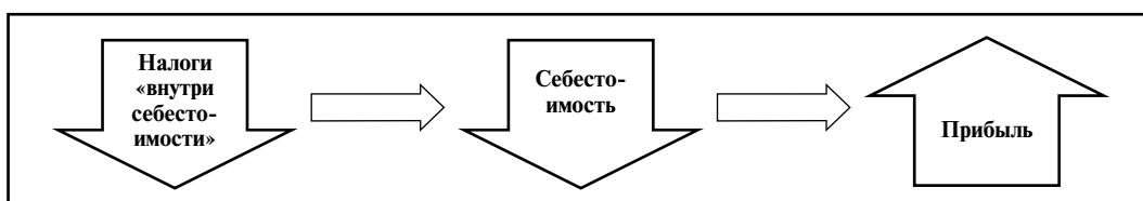
Рис. 2. Влияние изменения налогов «внутри себестоимости» на величину прибыли

Из схемы (рис. 2) видно, что снижение налогов «внутри себестоимости» способствует уменьшению величины самой себестоимости и росту прибыли. В свою очередь увеличение размера прибыли способствует увеличению налоговых платежей в бюджет по налогу на прибыль. Поэтому минимизация данной