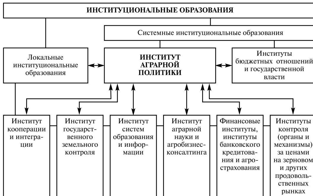
Рис. 2. Институциональное окружение аграрной политики

ческим и теоретическим потенциалом. Методология институциональных изменений позволяет рассматривать агропромышленный комплекс как открытую целостную социально-экономическую систему жизнеобеспечения 1 , состоящую из органически взаимосвязанных структурообразующих элементов, функционирование каждого из которых влияет на развитие как смежных элементов, так и всей системы в целом. Поэтому его функционирование зависит от слаженности механизмов саморегулирования и стратегий управления, целостного институционального окружения аграрной политики (рис. 2).