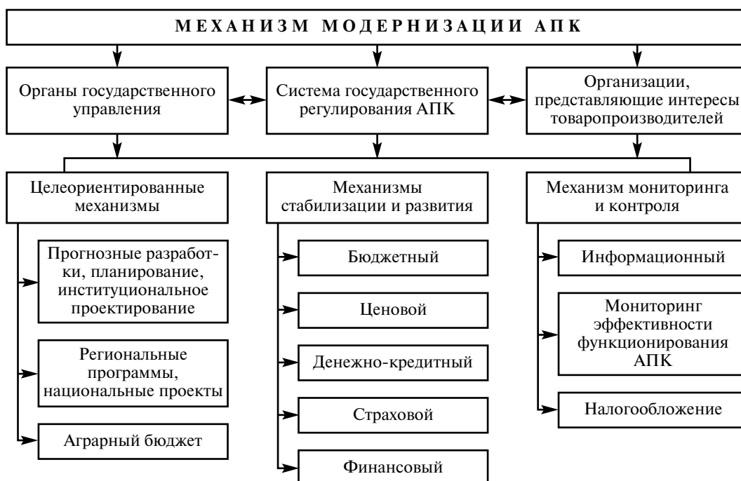
Рис. 3. Организационно-экономический механизм модернизации АПК

Механизм модернизационной стратегии системы регулирования АПК формируется на единой общегосударственной основе, базирующейся на соответствующих взаимосвязях (рис. 3).