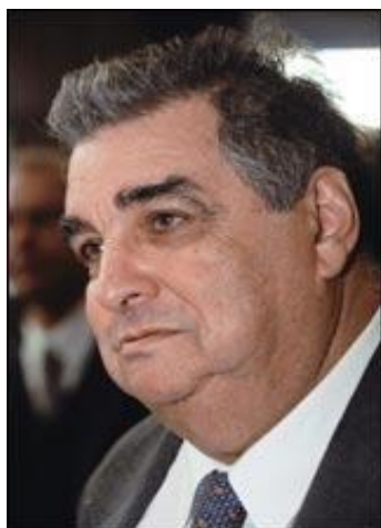
Аганбегян Абел Гезевич Академик РАН, д-р экон. наук. РАНХ зав. кафедрой экономической теории и политики