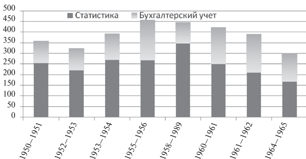
Рис. 1. Статистические и учетно-аналитические дисциплины в учебных планах ЛГУ по специальности «Политэкономия» (1950—1965 гг.), в учебных аудиторных часах (составлено по: ЦГА СПб, ф. Р-7240, оп. 15, д. 759, л. 1; д. 1620, л. 46; д. 77, л. 31; д. 1885, л. 12; д. 2429, л. 9; д. 395, л. 15; д. 1148, л. 8; д. 1383, л. 10; Статистика..., 2010, с. 200—202).

С середины XX в. бухгалтерский учет и анализ хозяйственной деятельности появляются в учебных планах специальности «Политэкономия». На рис. 1 представлена доля учебных часов по этим дисциплинам в учебных планах ЛГУ за период с 1950 по 1965 г.