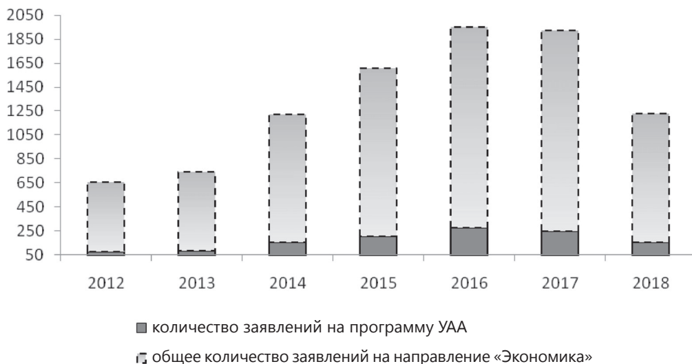
Рис. 2. Динамика заявлений на программу «Учет, анализ, аудит» и общего количества заявлений на направление «Экономика» магистратуры СПбГУ за период 2012–2018 гг. (бюджетные места)

Анализ сведений о поступлении в магистратуру СПбГУ за период 2012–2018 гг. показал, что количество поступивших на бюджетные места на программу «Учет, анализ, аудит» выросло с семи человек в 2013 г. до 15 – в 2018 г. Динамика заявлений с первым приоритетом 1 на программу «Учет, анализ, аудит» имеет положительную тенденцию и растет одновременно с ростом количества заявлений абитуриентов в магистратуру СПбГУ на направление «Экономика», но с большим темпом изменения 112,4% (111,0%) (рис. 3). Такой активный рост количества заявлений на аккредитованную программу свидетельствует о растущем интересе к ней со стороны абитуриентов. Видимый спад количества заявлений в 2018 г. случился из-за существенного изменения Правил приема в магистратуру СПбГУ, которые повлияли в т.ч. и на показатель количества поступающих на одно бюджетное место (рис. 2).