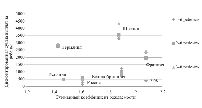
Рис. 1. Дисконтированные суммы выплат и суммарный коэффициент рождаемости по странам

Графически связь между рождаемостью и выплатами, положенными за рождение детей, представлена на рис. 1.