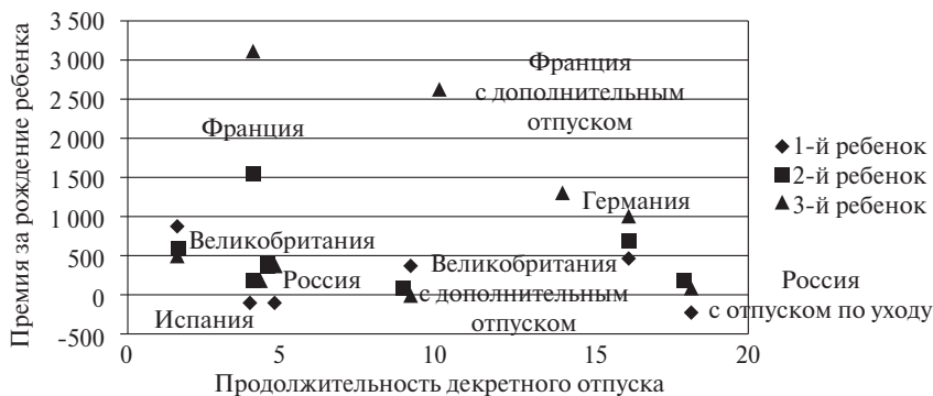
Рис. 5. Дисконтированные суммы выплат по странам

Необходимо сравнить общий объем выплат, приходящийся на семью, в случае рождения ребенка и доход матери за период декретного отпуска, который она не получит, в случае, если родит ребенка и будет сидеть с ним дома. Если для стран с более длинным декретным отпуском совокупный бонус за ребенка окажется ниже, чем в странах с коротким отпуском, то можно говорить о влиянии этого фактора. Данные по странам представлены на рис. 5: