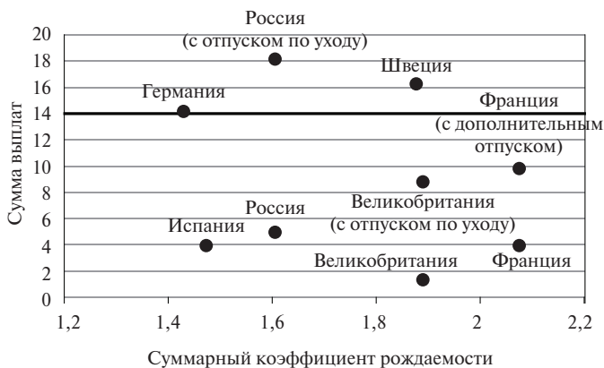
Рис. 4. Отношение оплаты в декретном отпуске к средней заработной плате

На рис. 3 видна отчетливая отрицательная корреляция между рождаемостью и продолжительностью декретного отпуска. Точные ее значения составляют -0,37 для первого и второго детей и -0,22 для третьего ребенка. Такая отрицательная корреляция может иметь двойственную природу. С одной стороны, поскольку в странах, где отпуск более продолжительный, доля заработной платы, которая выплачивается матери, находящейся в отпуске, ниже — корреляция этих показателей составляет -0,64 , (см. рис. 4), что приводит к денежным потерям для семьи. С другой стороны, более длинный отпуск предполагает выключение на большее время из трудового процесса, утрату профессиональной квалификации и более низкую зарплату впоследствии.